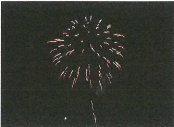
パッと出た花火だ、きれいだなあ、空一杯にひろがってー♪