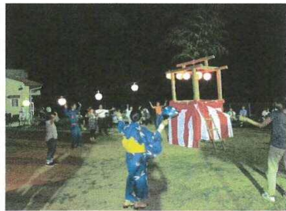
踊り子さんよおー、まわり子よおー。

に比べると人数も少ないながらも抽選会に入り、皆さんのテンションも上がり『自分が当選するもの』と数字を見ながら、全体が盛り上がりました。当選された方の喜びの声や当選しなかった落胆の声が入り乱れたところにドォーンの花火が打ち上げられ、一夜の楽しみが