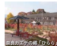
奈良カエデの郷「ひらら」

平成25年4月にオープンした奈良カエデの郷「ひらら」。国内外のカエデを一箇所に集約した植物園は全国でココだけ。その種類1200種!