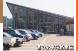
道の駅宇陀路室生

情報コーナーでは、周辺の観光情報もたくさん入手でき、物産店では、地元の特産をはじめ、近接市町村の物産の展示・販売しています。