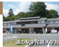
道の駅宇陀路大宇陀

レストラン『甘羅』では、地元産の宇陀牛を使ったメニュー等があります。お土産の販売や、産直市場、足湯もありとても賑わっています。またレンタサイクルもやっており、これで巡るのははかなりオススメ!