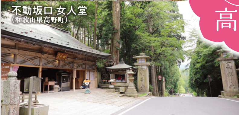
不動坂口 女人堂 (和歌山県高野町)