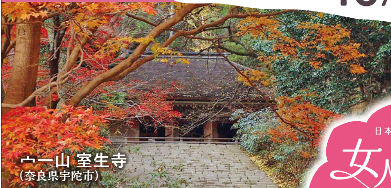
一山 室生寺 (奈良県宇陀市)