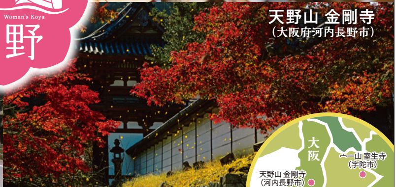
天野山 金剛寺 (大阪府河内長野市)