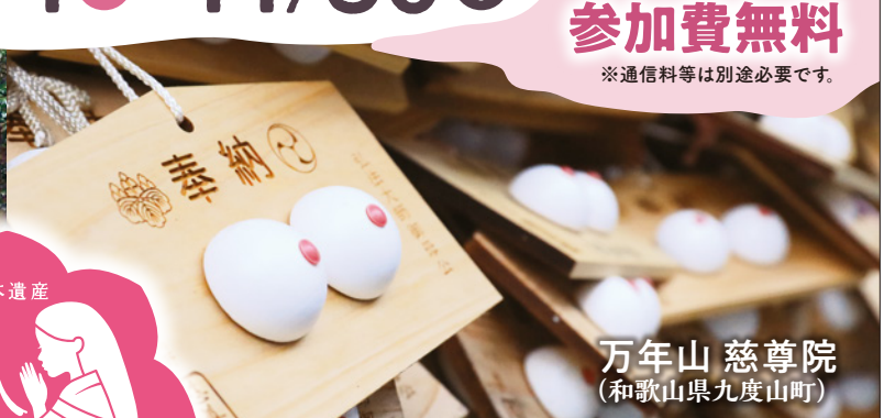
万年山 慈尊院 (和歌山県九度山町)