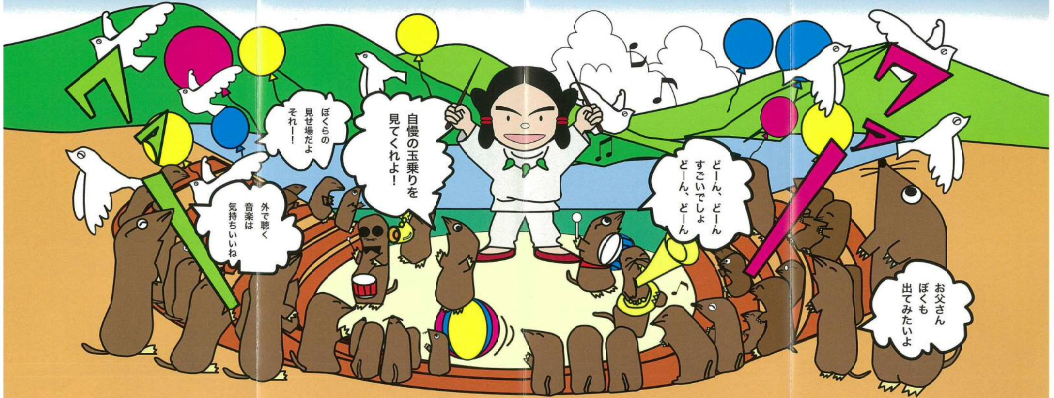
室生公園あさぎりの里案内マップ