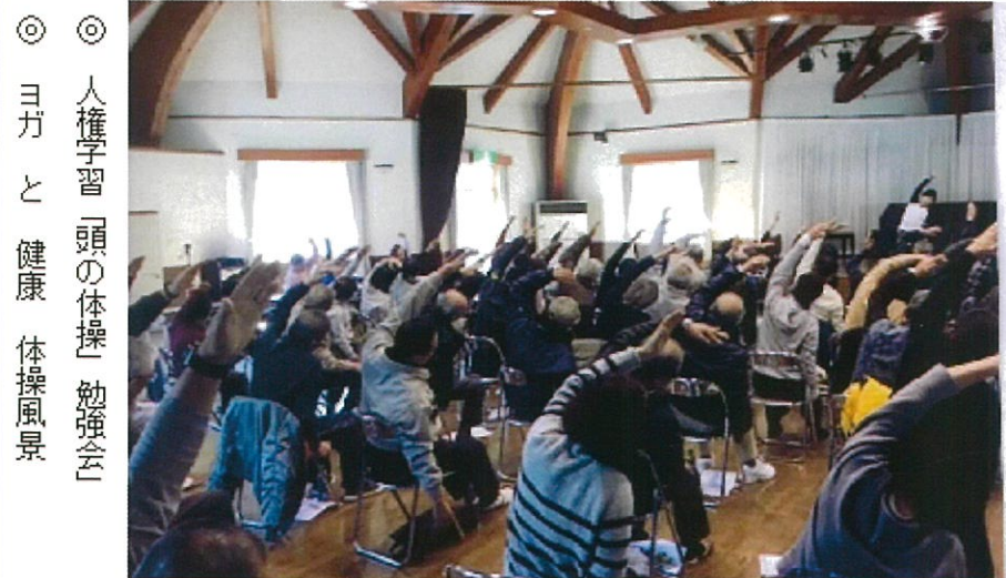
◎ ◎ 人権学習「頭の体操」勉強会 ◎ ◎ ヨガと健康 体操風景