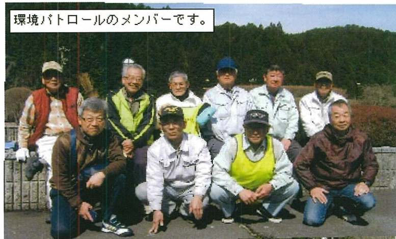
環境パトロールのメンバーです。

内牧地域まちづくり協議会の生活環境部会と内牧地区連合自治会との共催でパトロール隊を編成して2ヶ月に1回の道路や周辺環境パトロールを交互に実施。29年度最後の3月18日に地域内のパトロールが実施されました。回収したゴミ、缶等は分別のうえ、ボランティア用ゴミ袋に収納しゴミセンターに持込をしています。大型ゴミや不法投棄等発見した場合は、宇陀市環境対策課に連絡を取り対応しています。各地域に「不法投棄禁止・空き缶等のポイ捨て禁止」看板も建てて環境にやさしい地域活動をしています。(生活環境部会・内牧地区連合自治会)