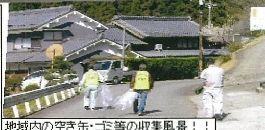
地域内の空き缶・ゴミ等の収集風景！！

お願い！ 不法投棄等発見したら宇陀市環境対策課又は環境パトロール隊員各自自治会長さんへ御連絡下さい。