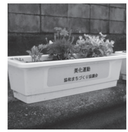
▲設置されたプランター

花を植えたプランターは、地域のバス停3か所(小附、内原、梅の木)や中河原交差点、大宇陀人権交流センターにそれぞれ設置し、地域の環境美化に少しでも貢献できればとの思いで、毎年夏と秋の2回実施しております。