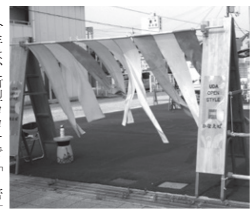
▲のれんが目印です

8月7日 榛原駅南口、auショップ横のスペースで榛原地区まち協が「駅前活性化応援プロジェクト」をスタートしました。宇陀市の玄関口、榛原駅前をにぎやかな市民の憩いの場にしたいたいとの思いで企画しました。会場の名称はUDA OPEN STYLE「かなえば」で、みんなの思いを叶える場所です。広場の入