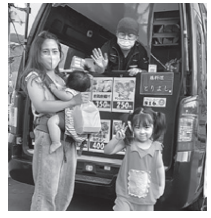
▲おいしい焼き鳥をゲット

も注意しながらの営業となるため、テイクアウトのみでスタートとなりました。しばらくはキッチンカーで毎週金曜日に販売し、週替りで違う店舗を予定しています。初回は鶏料理「とりよし」の美味しい焼き鳥と唐揚げでした。開店後、目印の大きな「のれん」と「のぼり」に足を止める方も多く、キッチンカーの後ろには列ができました。かわいい女の子を連れただご家族も焼き鳥の唐揚げや焼き鳥をたくさん購入されました。今後、タピオカドリンクやクレール、焼ききたてピッツァ、おやつ工房などいろいろなお店が出店していきます。