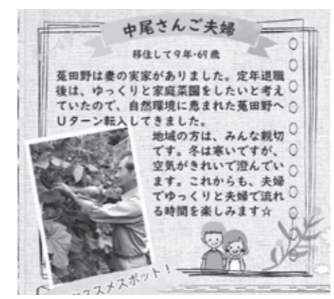
▲移住された方のコメント

業さんの窓口にも置かせていただく予定です。 新しいMAPを持って、コースを巡って下さいね。