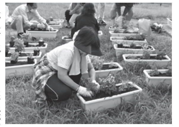
▲テキパキと植付け作業

7月12日、活動の一つである『地域の環境美化と景観の保持』を目的とした花いっぱい活動を実施しました。この事業は、今年で4年目を迎えますが、今年はコロナ禍のなか、普段とは違い、特に感染拡大予防の対策として、参加者は全員マスクの着用と作業開始前に検温を実施しました。また、作業中はソーシャルディスタンスにも十分注意しながらの作業となりましたが、慣れたもので短時間での植え付けを終えました。