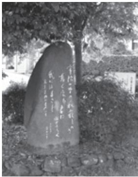
▲あかね台万葉歌碑

【申し込み】希望日・コース、氏名、当日連絡のつく電話番号を明記し☎、FAX、郵送で。