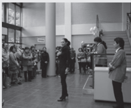
▲毛皮革製品オークションの様子

菟田野地域は、毛皮製品をはじめレザーや鹿皮、様々な毛皮革製品を取り扱い、特に鹿皮においては製造取扱量が全国シェア約90%の一大生産地です。このフェアでは、企画・生産まで備えた最新の製造技術一貫システムによるファーやレザーファッションをはじめ、高品質なバックなど、各種毛皮革製品の展示・販売を行います。