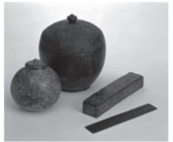
▲国宝 文祢麻呂墓出土品（模造）