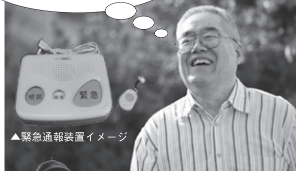
▲緊急通報装置イメージ