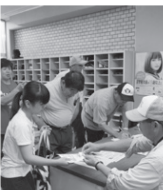
▲たくさんの方が参加されました

ました。 当日は、梅雨の中休みの蒸し暑い日でしたが、小学生から80歳代までの幅広い年齢層で、56人もの方々の参加がありました。