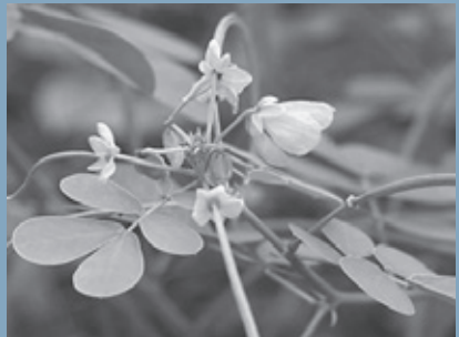
▲高血圧や腎臓・肝臓病改善の効果があるエビスグサ

陰干しにして保存します。使用の際には少し焙じて用いるほうが良いのですが、黒くなるまで炒って焦がすか、炒って長く置いたものはかえって効果がなくなります。料理にするには、炒って煮詰めて皮を除き、さらに煮詰めて薬用成分を種子に再吸収させ、もろみで味を付けるといった方法が基本です。 薬用成分を損なわず、しかも全体を食べることができるので効果は高くなります。エビスグサの種子は20〜25グラムを煎じて飲むのと、4〜5グラムを食べるのは同じ効果が、少量で高血圧や腎臓・肝臓病改善などの効果が期待できることとなります。