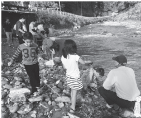
▲蛍博士と一緒に放流したよ

てきてくれるように川をきれいにしようとして子どもたちは蛍博士と約束をし、みんなで蛍の幼虫を放流しました。また、和太鼓演奏、歌や踊りのお楽しみイベントもあり日暮れまで盛り上がっていました。日暮れ後、蛍を鑑賞するためたくさんの方が訪れ、幻想的な蛍の光に歓喜の声が夜空に響いていました。