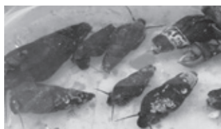
▲幼虫のえさ「カワニナ」

てきてくれるように川をきれいにしようとして子どもたちは蛍博士と約束をし、みんなで蛍の幼虫を放流しました。また、和太鼓演奏、歌や踊りのお楽しみイベントもあり日暮れまで盛り上がっていました。日暮れ後、蛍を鑑賞するためたくさんの方が訪れ、幻想的な蛍の光に歓喜の声が夜空に響いていました。