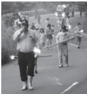
▲ほら貝の音と共に、隣の地域との境界まで練り歩く 下笠間地区

残念ながら中止となりました。午後7時、虫送りの開始を告げる太鼓や鐘、ほら貝などを合図に、長いものではおよそ3メートルもある松明や、子ども用の松明を持った老若男女が集まりました。辺りが暗くなった頃、田植えが終わった水田のまわりや地域内を松明の灯りとともに練り歩き、隣の集落との境で松明を持ち寄り、一つにまとめて燃やし、今年の豊穡を願いました。