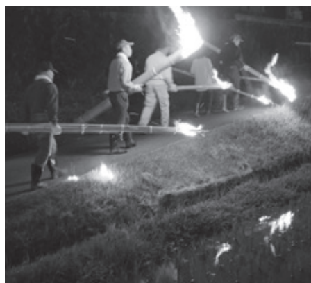
▲松明の光が水田に映る 染田地区

市北部を山添村に向かつて流れる笠間川。この流域では、毎年6月に伝統行事として虫送りが行われています。「虫送り」は、五穀豊穡と虫の供養を兼ねて行われています。16日に多田地区まち協内の無山地区と染田地区、17日に笠間地区まち協の下笠間地区と、20日に小原地区で続けられています。しかし、小原地区は悪天候により、