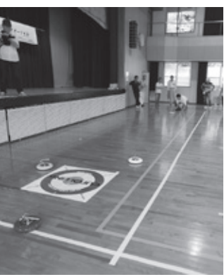
▲床の上で出来るカローリング

今回は、市体育協会菟田野支部の共催と市スポーツ推進委員の皆さんの協力もあり、各競技の説明や、審判員と