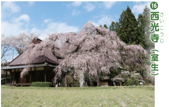
16 西光寺 (室生)

女人高野や石楠花で知られる室生寺ですが、染井吉野や山桜など寺院内の桜も見事に咲き誇ります。広い寺院内で桜めぐりの散歩も楽しめます。