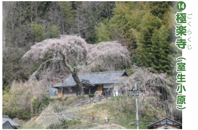
14 極楽寺 (室生小原)

小原の里を見下ろす高台にある極楽寺境内の枝垂れ桜。樹齢は推定300年余りといわれています。極楽寺は明治32年に焼失し、のちに再建されましたが現在は無住寺。