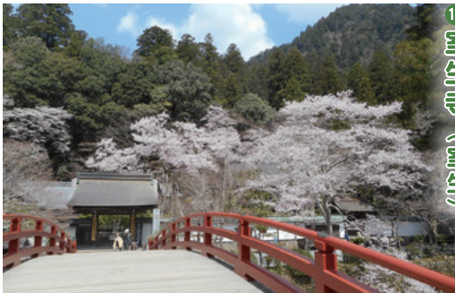
17 室生寺 (室生)

小原の里を見下ろす高台にある極楽寺境内の枝垂れ桜。樹齢は推定300年余りといわれています。極楽寺は明治32年に焼失し、のちに再建されましたが現在は無住寺。