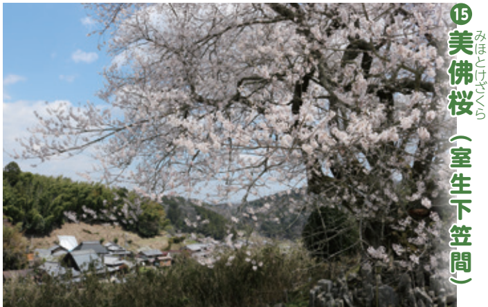
15 美佛桜 (室生下笠間)

集落の高台に立ち、その名の通り、その姿は集落のどの場所からでもうかがえるような存在感があります。素朴ながら日本の美しい農村風景が人々を魅了します。