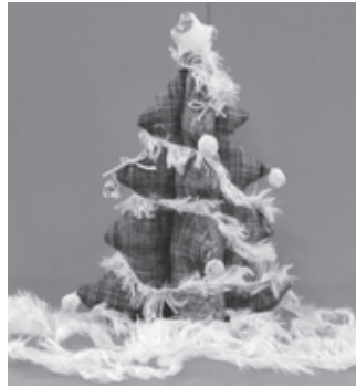
▲ちりめん細工で作ったツリー