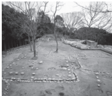
▲史跡 宇陀松山城本丸御殿跡

調査開始から23年。発掘現場の臨場感とともに、20年余の調査の春秋(歳月)をご覧ください。