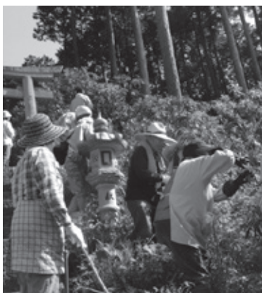
▲みなさん一斉に作業を開始

当日は、地域の方やボランティア40 人余りが参加。一日かけて数千本の石 楠花の花がらを丁寧に摘み取りまし た。参加者は「作業は大変でしたが、 来年も石楠花でいっぱい弁財天を楽 しみにしています。」と語り、額の汗 をぬぐっていました。