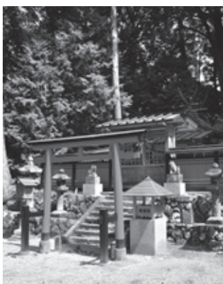
▲火祭り有名な菅原神社

これからも、自分たちの地域の歴史 にふれることで、地域の宝物を知り、 地域の財産を継承していく取り組みを 進めていきます。