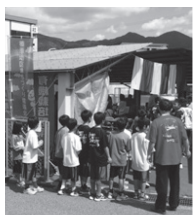
▲「宇陀」にこだわった産直市場