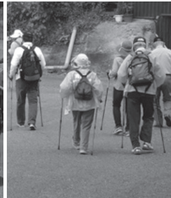
▲最近ブームのノルディックウォーク