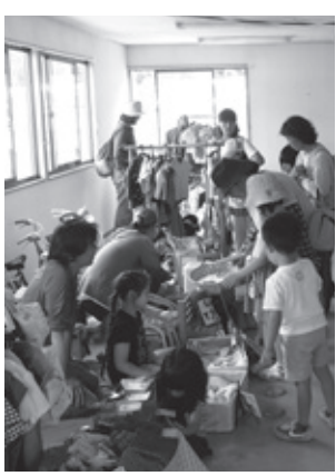
▲人気のあったフリマ