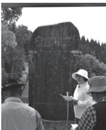
▲旧田原小に建立されている石碑