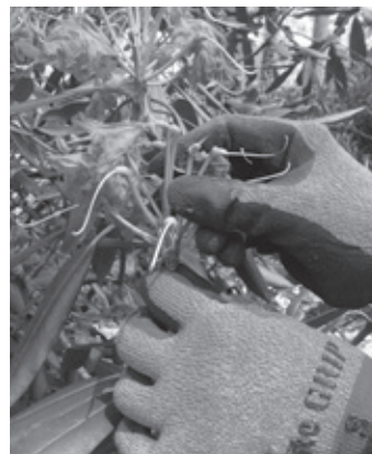
▲丁寧に花がらを摘み取る

駐車場では、産直野菜、ハチミツ、 陶器、カフェなど様々なブースがあり 子どもから大人まで楽しく過ごせる一 日になりました。