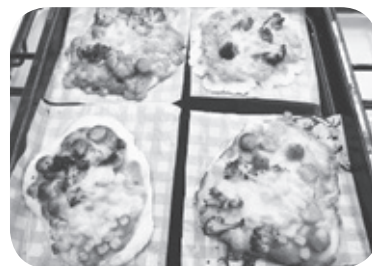
畑で作った野菜で料理!