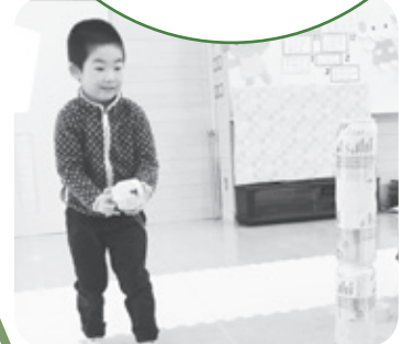
幼稚園等のお友達も遊べるよ

開催日 毎月2回程度 開催時間 14:30～15:30 対象 市内在住の就学前 の子どもとその 保護者