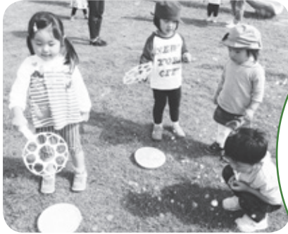
フレンドパークにて