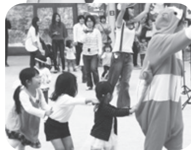
すくすくフェスティバルの様子