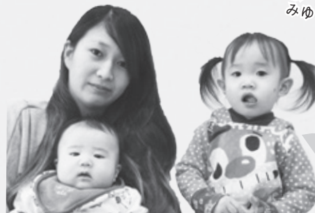
神殿 千恵ママ けいくん・はなちゃん

楽しく子育 てできるヒント がたくさんある と思うので、ぜ ひ利用してみ てね。