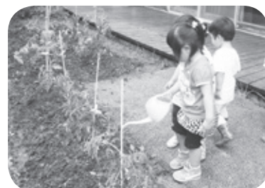
すくすく畑で野菜に水やり中