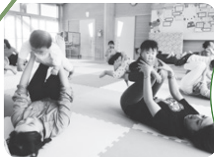
親子ヨガ教室の様子