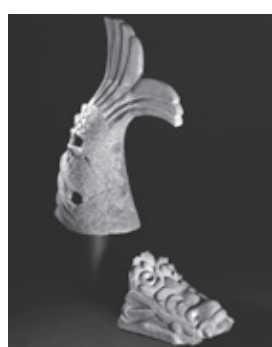
宇陀松山跡出土 鏡瓦

特集 市政トピックス うだぢから まちのわだい みんなで子育て 病院・ウエルネス お知らせ 産業・まちづくり 他 掲示板 うだちゃん