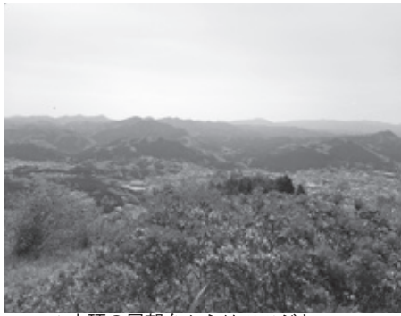
▲山頂の展望台からはツツジと一緒に市内を見渡せます

(☎82・2457 / IP ☎88・9081) 【問】市観光案内所「うだ観処」 (IP ☎88・9049)