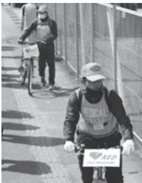
▲安全性が高いため、職員も安心して対応しています。大会当日は、消防署や消防団、ボランティアなど、多くのボランティアの方々が協力してくれています。

また、これからも地域の方々に「やって良かった」と思ってもらえる大会であって欲しいと思います。