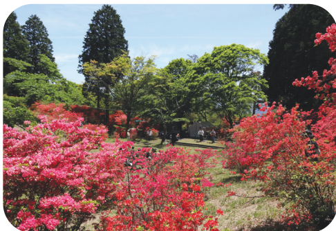
つつじ祭のようす

これからの時期、とても新緑がきれいです。公園内には、2カ所の展望台もあります。ぜひ、訪れてみてください。