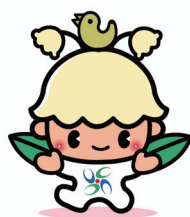
【マスコットキャラクター】 ウッピー