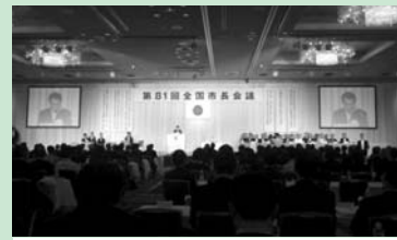
全国市長会のようす(6月8日)

感じられないほど気さくな方で、故郷の思いを話されました。宇陀市出身ということは、私たちの誇りです。オービックの力を、私たちの宇陀市にもと思うところで。