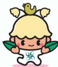
【マスコットキャラクター】 ウッピー