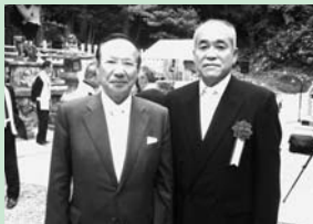
春日神社の造営式典で野田会長(左)と撮影(6月5日)

また、南相馬市長が発言を求め、全国の被災者を受け入れている市町村に感謝とお礼を述べられました。市長会が政府に要請するのではなく、自ら行動していくという姿勢に共感しました。