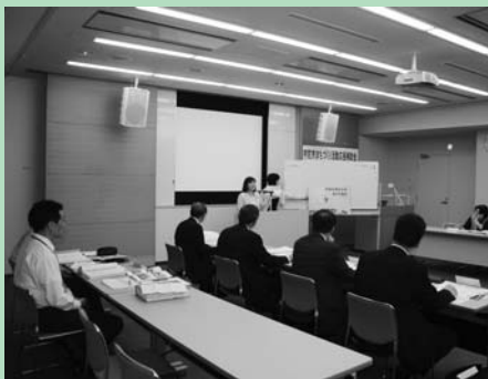
【公開プレゼンテーションのようす】

「市民が主役のまちづくり、地域の個性を生かしたまちづくり」の実現に向けて、市内で活動する市民団体が自ら企画立案し、実施する事業に対して助成する「宇陀市まちづくり活動応援補助金」に、19事業の応募がありました。