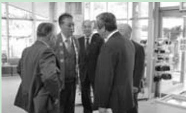
宇陀市議会第1回定例会 総務委員会道の駅室生の現地視察(3月10日)