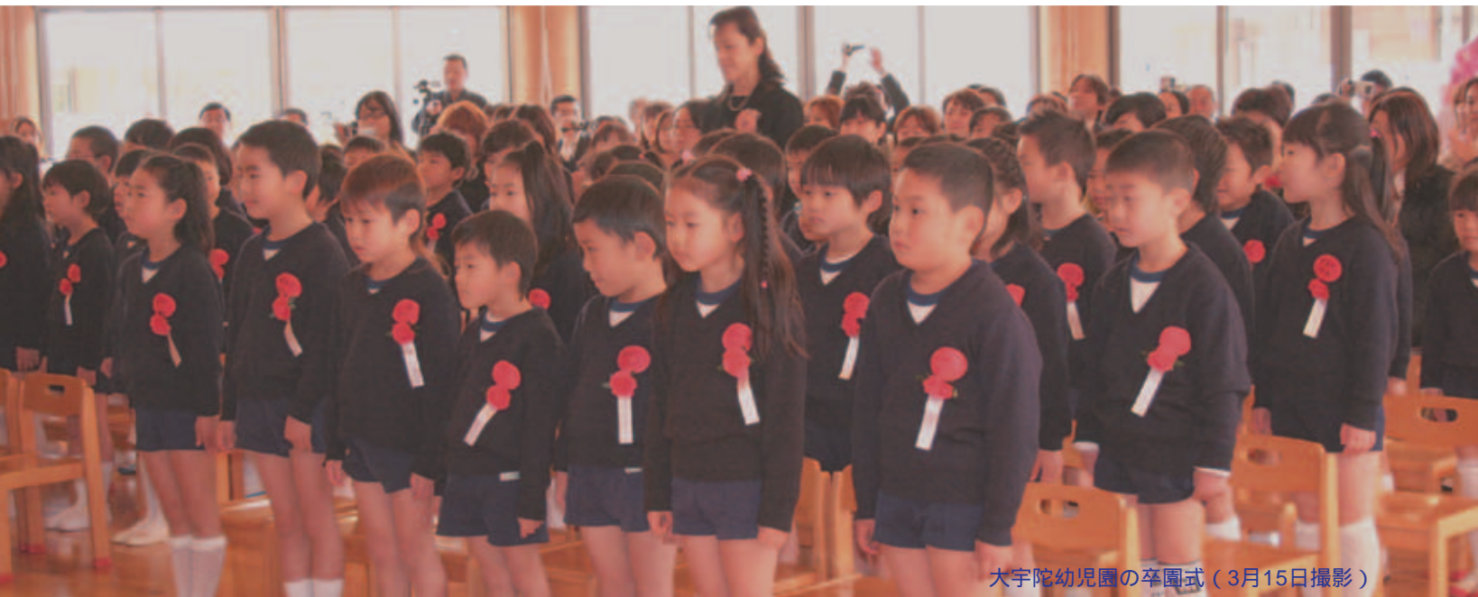
大宇陀幼稚園の卒園式(3月15日撮影)