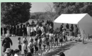
市町村対抗子ども駅伝大会のようす(3月5日)