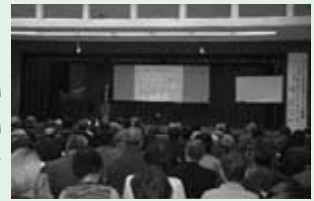
熟睡感を得るためには6～7時間の睡眠が必要です

市では、これからもこころの健康づくりについて、正しく理解をしていただくための取り組みを推進していきます。