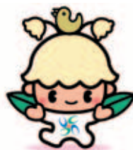
マスコットキャラクター ウッピー