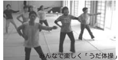
みんな楽しく「うだ体操」

「運動のつどい」は、室生の運動教室元メンバーを中心に活動しています。年4回、スポーツインストラクターの指導を受けながら、自分にあった運動を考えて、ストレッチ、筋力トレーニング、エアロビクス、バランスボールなどで汗を流しています。 活動日時 毎週月曜日(祝日、お盆、年末年始は休み) 午後1時15分～3時30分 場所 室生福祉保健交流センター 会費 1,000円/月 講師代、施設使用料) 持ち物 運動しやすい服装・タオル・水筒