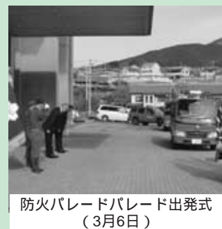
防火パレードパレード出発式(3月6日)

なまちづくりができる仕組みを作りたいと考えています。宇陀市を思う多くの人たちと共に、志を高く持って、今、「宇陀市を希望が持てるまち」にしたいと思えます。そしてこの宇陀市が、私たちの子供たちに希望を持って受け継がれるよう精一杯頑張りたいと思うところでございます。 春とは申しまして、季節の変わり目でございます。健康に十分に気をつけてお過ごしください。