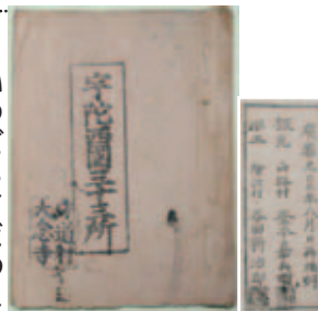
「宇陀西国三十三所」御詠歌集より 大念寺 大宇陀区守道 蔵

宇陀にも地域霊場の一つとして誕生した「宇陀三十三所」(左記表)とよばれた観音信仰の霊場があり、多くの参詣者でにぎわいました。