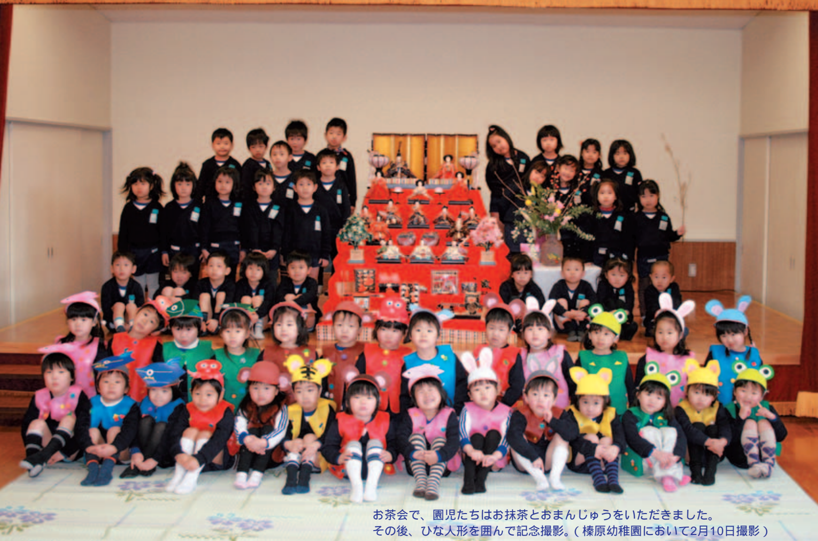
お茶会で、園児たちはお抹茶とおまんじゅうをいただきました。 その後、ひな人形を囲んで記念撮影。(榛原幼稚園において2月10日撮影)