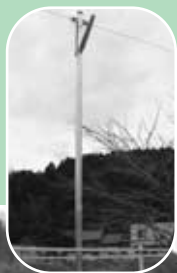
設置された防犯灯