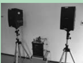
放送設備と組立式ステージ