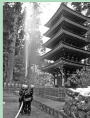
室生寺での消防演習の様子