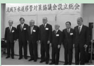
流域下水道移管対策協議会設立総会(1月31日)

宇陀市が誕生して6年目を迎え、大きく社会情勢が変わる中、市民の方々一人ひとりが、私たちが住む宇陀市について、考えなければならぬ時にきています。 とりわけ、少子高齢化や過疎化の問題は、我が宇陀市が直面する大きい課題であると感じています。まちづくり、むらづくり、雇用の場づくりに特効薬はございませんが、努力することが必要です。行政とともに考えながら地域づくりをしていきたいと思います。については、行政に様々な情報をお寄せください。宇陀市の将来を市民の皆様と共に考え、良い形・良い方向を見出したいと思えます。みんなで頑張りましょう。