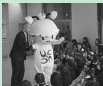
大宇陀幼稚園ウッピーと交流(1月28日)

また、今月は市内の各小中学校で卒業式も行われます。希望に満ちた卒業式、新たな出発を市民の皆様と一緒に祝いしたいと思います。