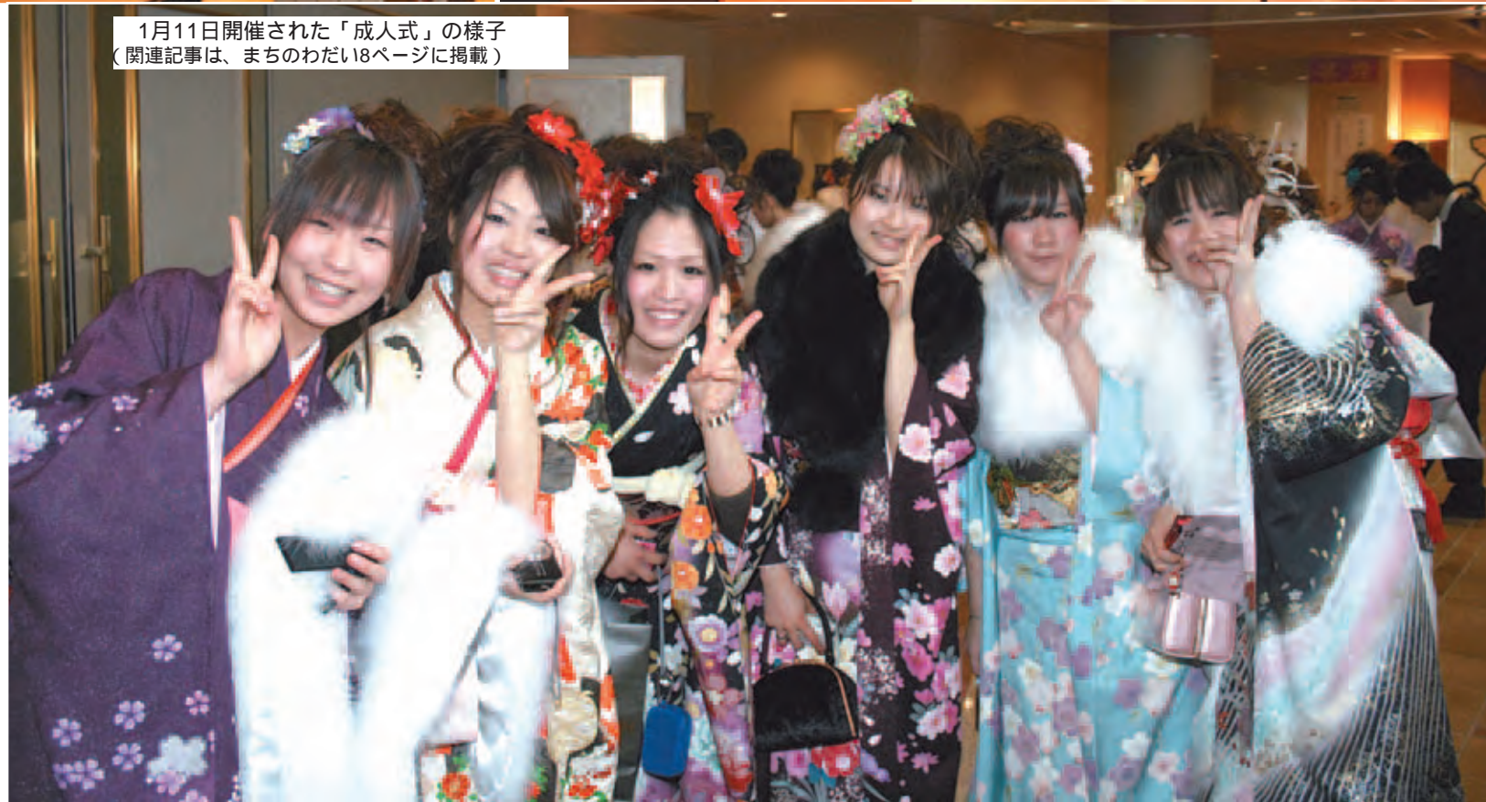
1月11日開催された「成人式」の様子 (関連記事は、まちのわだい8ページに掲載)