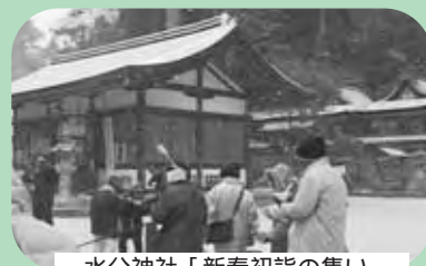
水分神社「新春初詣の集い」