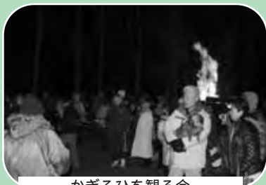
かぎろひを観る会