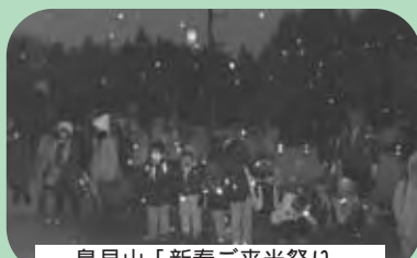
鳥見山「新春ご来光祭り」