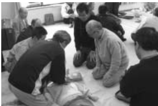
防災訓練のようす (榛原区篠栗自治会)

民・事業者のそれぞれの役割や民間事業所との物資供給に関する協定の推進など、災害に関する予防対策、応急対策及び復旧対策を定めています。