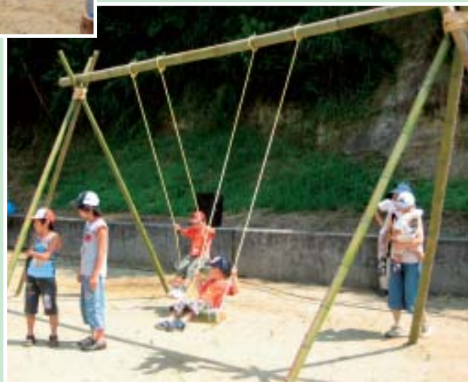
「竹と遊ぶ夏休みin向洲」のイベントを楽しむ参加者 (8月3日開催)