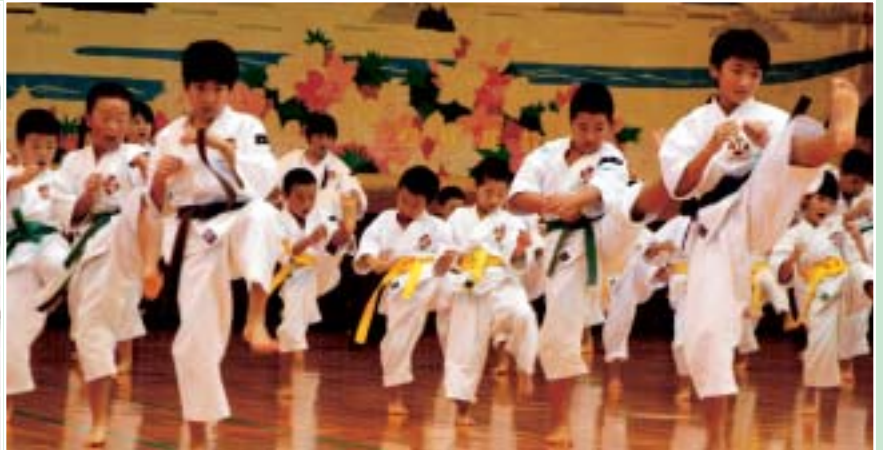
「子どもフェスタ2007」の様子（関連記事は、まちのわだい7頁に掲載しています。）