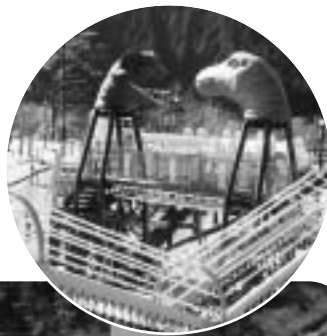
■平成榛原子供のもり公園