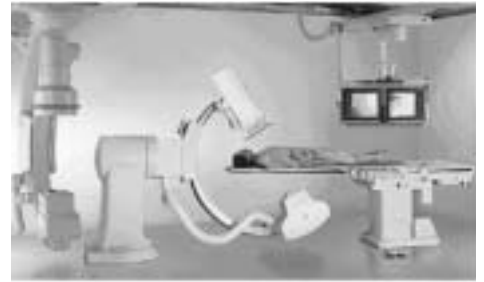
アンギオ・グラフィー装置 infix Celeve-i 循環器情報総合システム Cardio Agent 共に東芝メディカルシステムズ製

外科的手術法に比べて患者様の負担が少なく、入院日数や費用負担も少ないため、現在では循環器の診断と治療に欠かせないものとなっています。