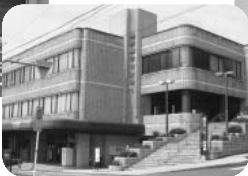
■榛原総合センター