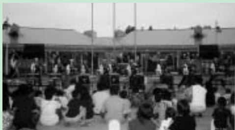
昨年の夕涼み会の様子

夕暮れのひとつきをみんなで楽しく過ごしませんか。花火や催し物を予定しています。ご近所お誘い合わせのうえ、たくさんの参加をお待ちしています。