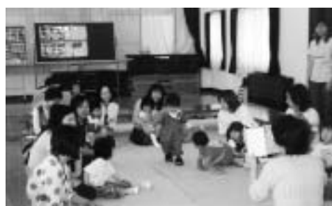
かんかんくらぶの様子