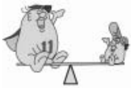
てんいち先生とひかりちゃん