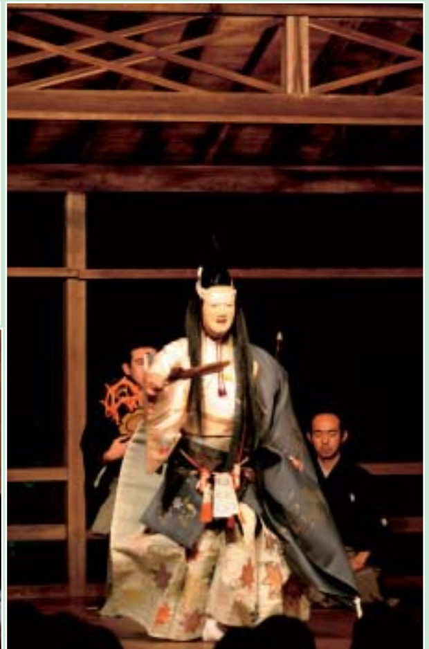
あきの螢能 (6月16日開催) 【写真】左上:狂言 左下:舞囃子 右:能楽 ※関連記事はまちのわだい(7頁)に掲載しています。