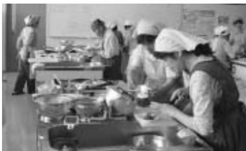
はつらつ料理教室【6月実施】

日時 7月12日(木)・26日(木) 午前10時～12時30分(受付:午前9時30分～10時) 場所 大宇陀保健センター(調理室) 対象 おおむね65歳以上の方で、一人暮らしや高齢者世帯の方