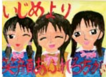
榛原小 杉山 裕依(5年)