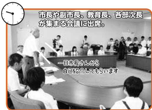
市長や副市長、教育長、各部長が集まる会議に出席。