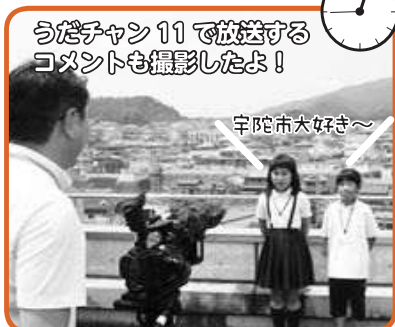
うだチャン11で放送するコメントも撮影したよ!