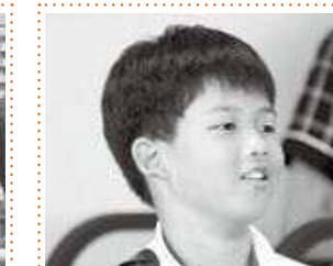
萬谷雅久 市長(大宇陀小) いじめのない楽しいまちになったら、いい宇陀市になると思います。