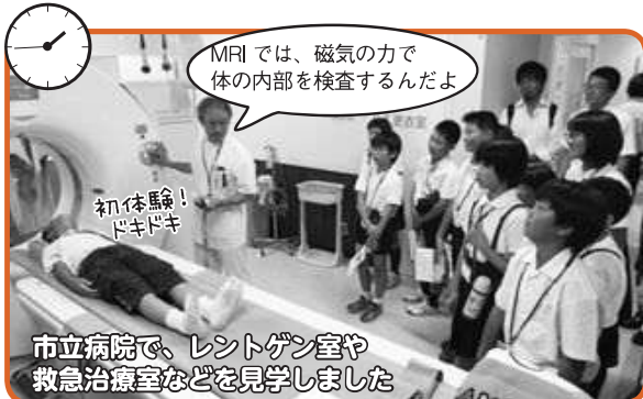
MRIでは、磁気ので体の内部を検査するんだよ