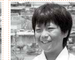
粉室結人 市長(榛原小) いろんな場所を見学したり、体験できてうれしかったです。また参加したいです。