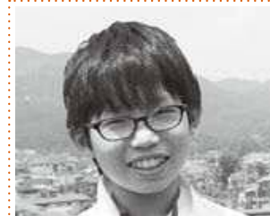
角田泰志 市長(榛原東小) 会議で市を良くするために、みんなの意見をまとめるのが特に大変だなと思いました。