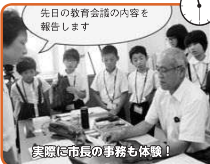
先日の教育会議の内容を報告します