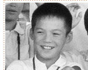
上村忠直 市長(室生西小) 実際に事務の話をしたり、決裁にサインをしたことは、僕にとって大きな経験でした。