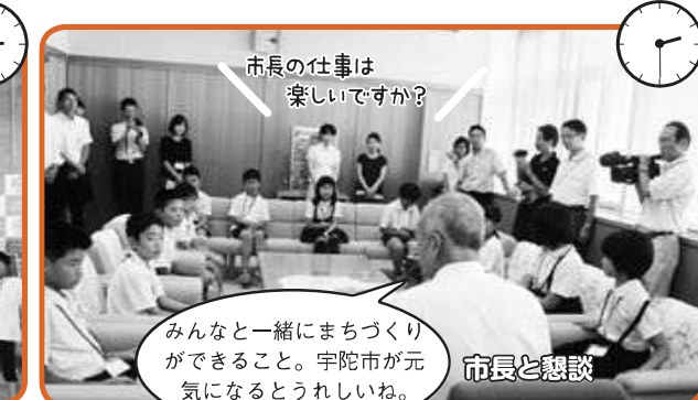
市長の仕事は楽しいですか?