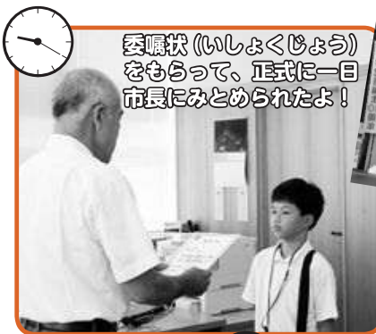
委嘱状(いしよくじょう)をもらって、正式に一日市長にみとめられたよ!