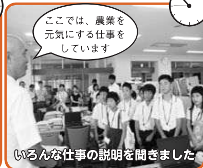
ここでは、農業を元気にする仕事をしています