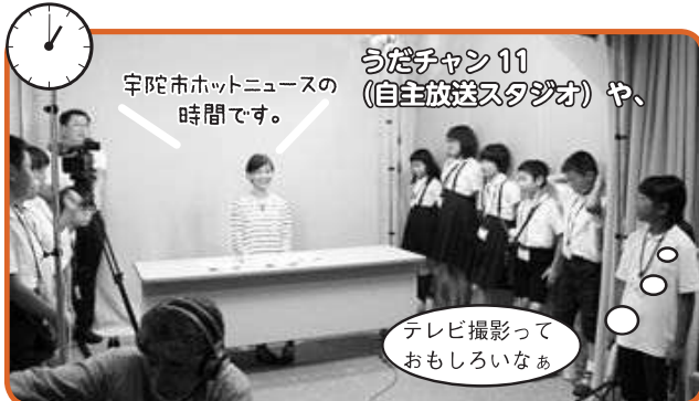
うだチャン11(自主放送スタジオ)や、宇陀市ホットニュースの時間です。