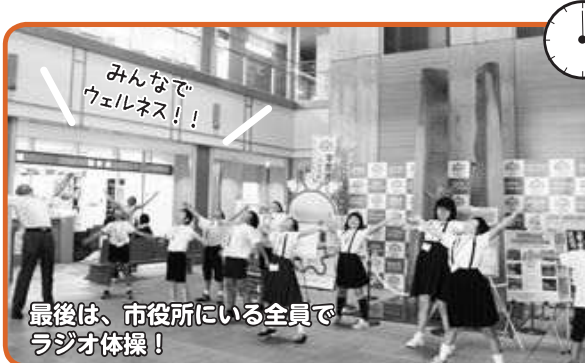
みんなでウェルネス!!