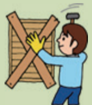
イラスト提供：気象庁